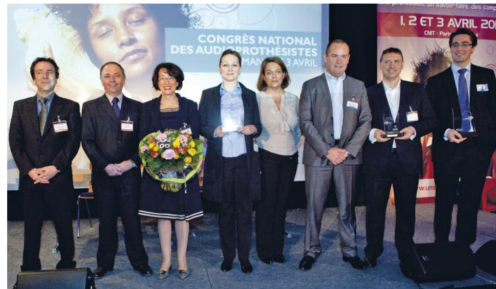
Remise des Prix UNSAF 2011