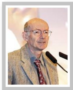
Président de la Journée Scientifique du Congrès

« De l'aide auditive au cerveau ! Que nous offre la technique pour améliorer le service audioprothétique rendu ? » Année 3