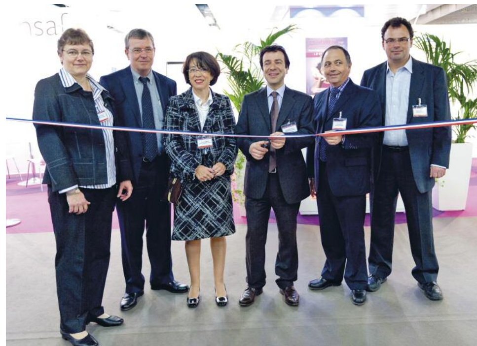
Inauguration lors du Congrès 2011

DE NOMBREUX EXPOSANTS VOUS ACCUEILLENT : Jeudi et Vendredi de 9H00 à 19H00 - Samedi de 9H00 à 17H00